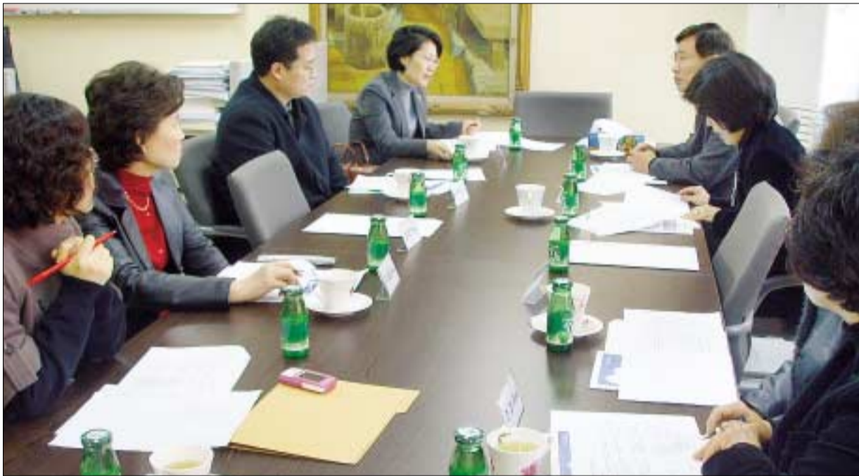
지역별로 자원봉사단체 가입설명회를 개최하고 있다.

17개 자원봉사센터, 자원봉사 배가운동 결의 후 41일간 17,104명 증가