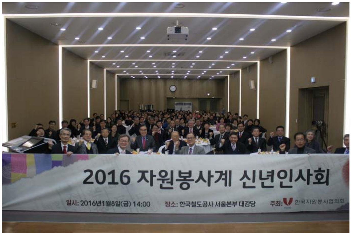
▲1월8일(금), 한국철도공사 서울본부 대강당에서 2016 자원봉사계 신년인사회가 열렸다.