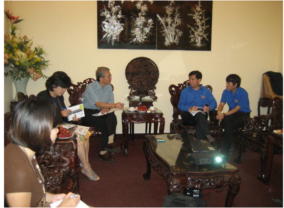
사진8. 정부관계자 간담회