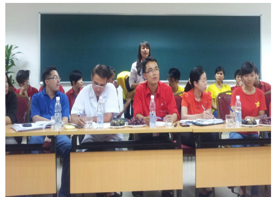
사진6. 하노이 혈액은행 방문