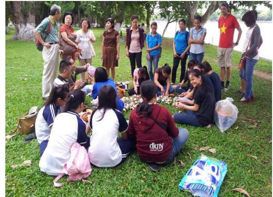
사진4. VVIRC 다낭 자원봉사동아리 자원봉사활동