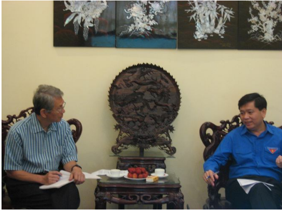
사진7. 정부관계자 간담회