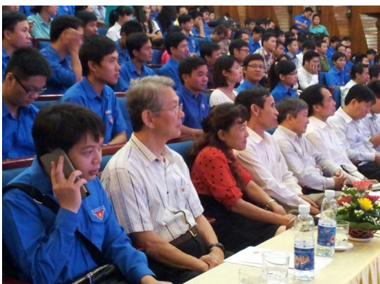
사진11. 전국청소년자원봉사자대회 참가