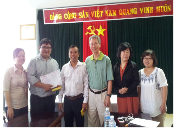
사진2. VVIRC 다낭센터 방문