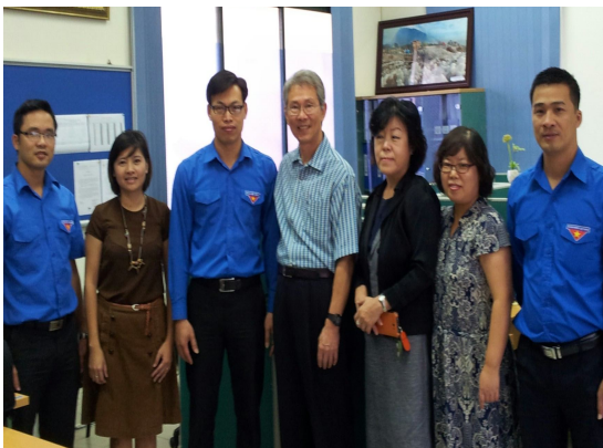
사진5. VVIRC 방문