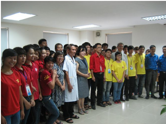
사진9. 혈액은행 방문