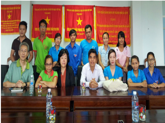
사진3. VVIRC 다낭 자원봉사동아리회장단 간담회