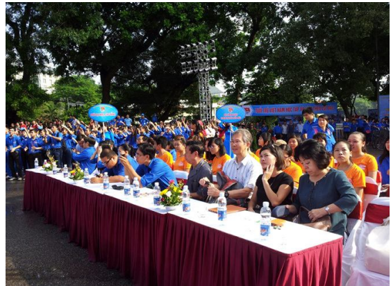
사진10. 전국청소년자원봉사자대회 참가