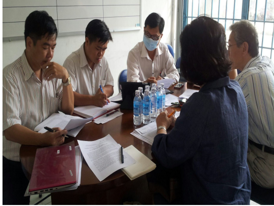
사진1. VVIRC 호치민센터 간담회