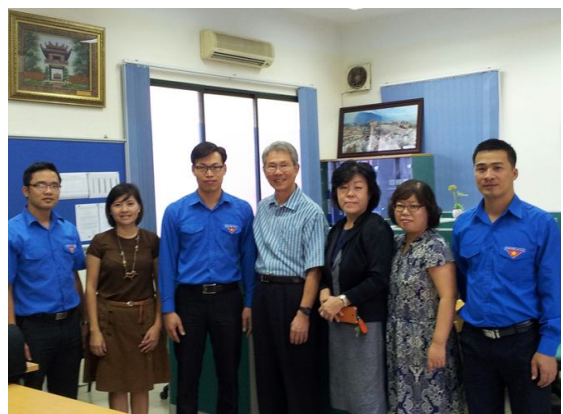
사진12. VVIRC 방문