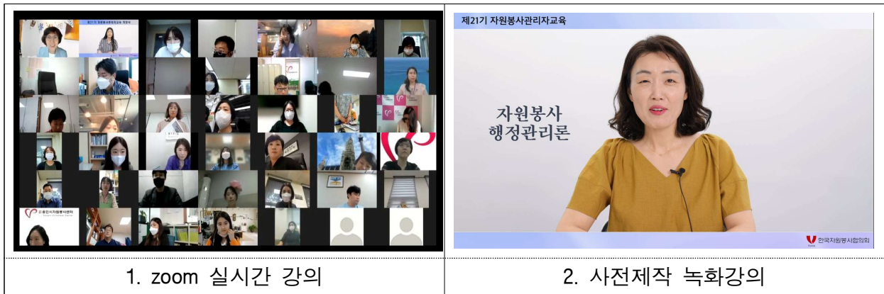
1. zoom 실시간 강의